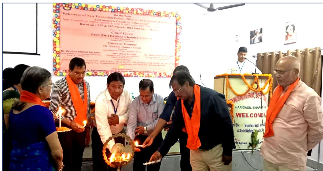
Two Days National Seminar Pictures : 27 th -28 th March, 2022