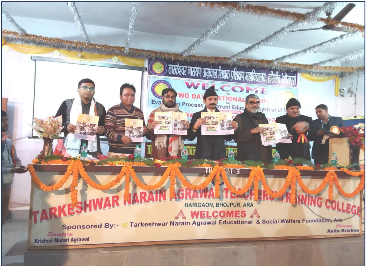
Two Days National Seminar Pictures : 19-20 December, 2019