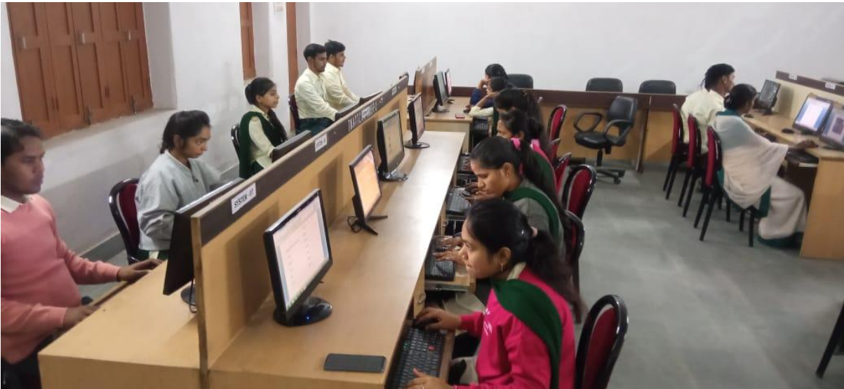
USE OF ICT BY STUDENTS