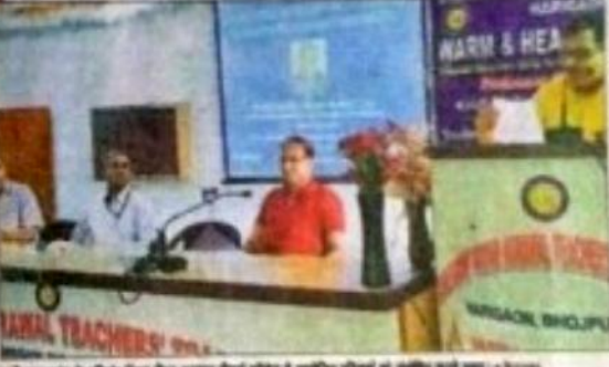
अनंदा टीएनटी का शुभारंभ करने के लिए टीएनटी का शुभारंभ किया गया है।

अनंदा टीएनटी का शुभारंभ करने के लिए टीएनटी का शुभारंभ किया गया है। इस कार्यक्रम के अंतर्गत शिक्षकों को प्रेरित करने के लिए टीएनटी का शुभारंभ किया गया है।