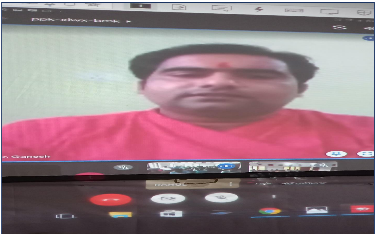
One Day Motivational Speech on Guru Purnima for B.Ed. Students. : 23 rd July, 2021