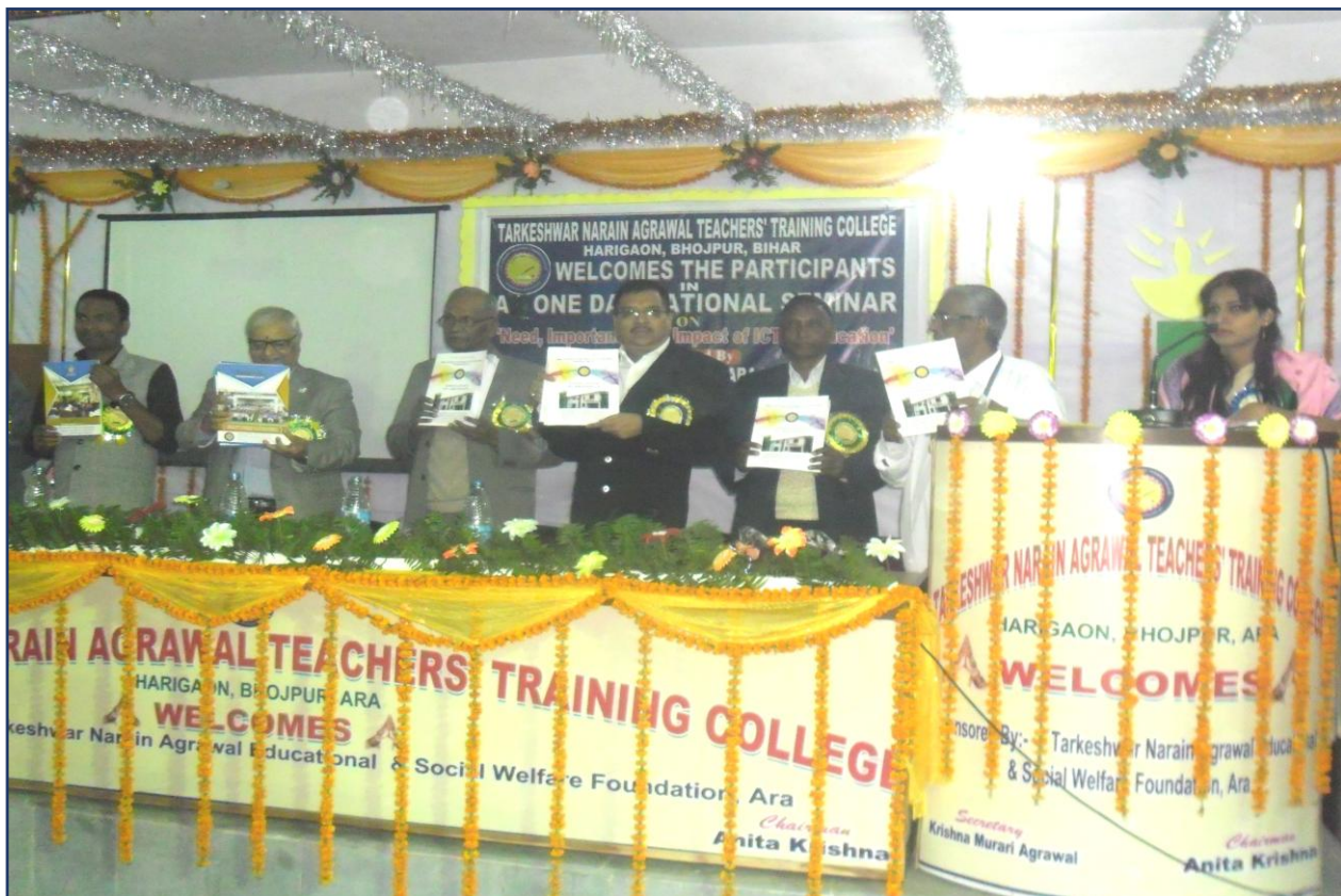
One Day National Seminar Pictures on Date 15 th December, 2017