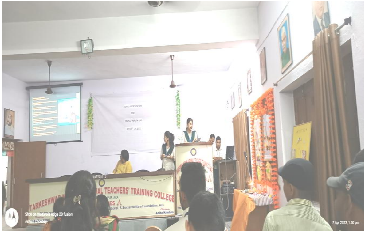
PPT PRESENTATION PICUTERS ON WORLD HEALTH DAY