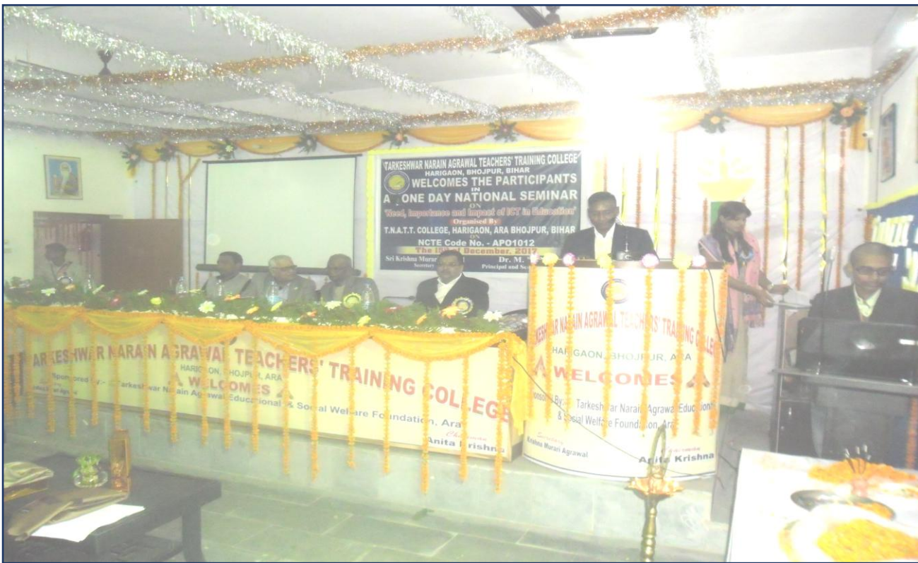
One Day National Seminar Pictures on Date 15 th December, 2017