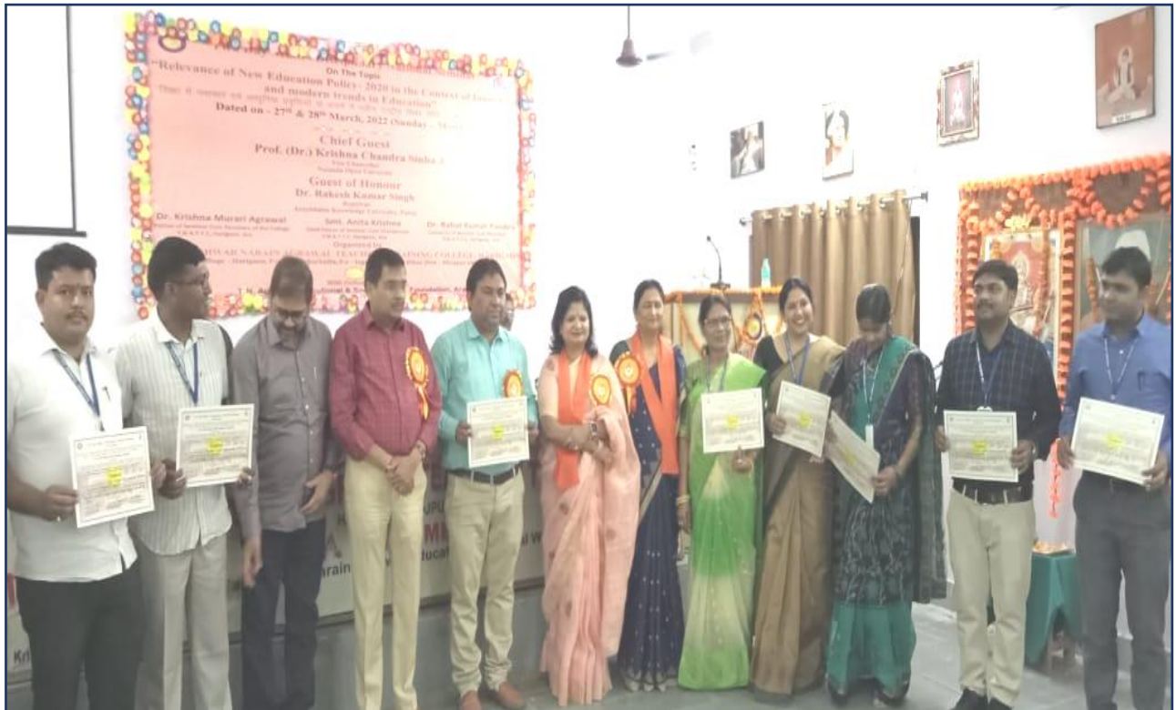
Two Days National Seminar Pictures: 27 th -28 th March, 2022