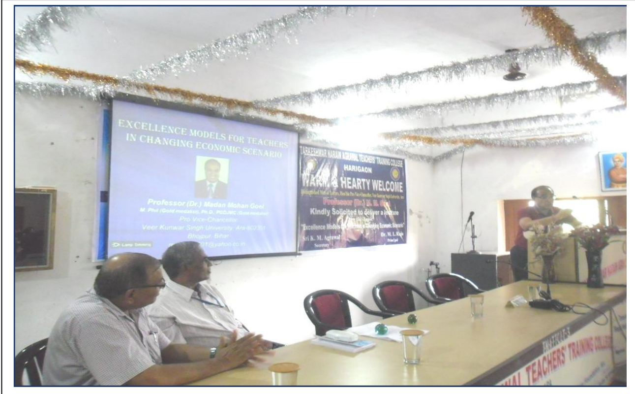
Motivational Speech on Excellence Models for Teachers in Changing Economical Scenario. Date: 13/07/2017